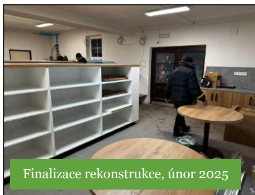
Finalizace rekonstrukce, únor 2025

Prodejnu jsme celkovým nákladem 1,3 mil. Kč opravili (podlaha, elektrika, kamna, okno, dveře...) a vybavili novými regály (děkujeme p.Valentovi za vstřícnost!), mrazáky, lednicemi a technologií prodeje. 50% investic se nám snad vrátí formou dotace od Královehradeckého kraje. Žádosti o dotace jsou podány.