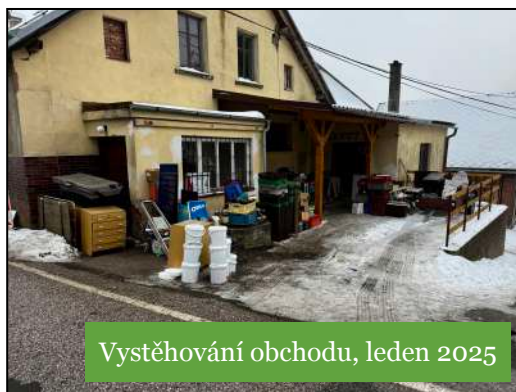
Vystěhování obchodu, leden 2025

Borovnička Obchodní s.r.o. má 1 zaměstnance , který bude zajišťovat provoz obchodu a Vám bude pomáhat s nákupem. Na toto místo jsme v lednu 2025 vyhlásili výběrové řízení a z celkem 3 uchazečů vybrali jednoho, se kterým jsme se zároveň domluvili na tom, že bude zajišťovat i údržbu obecního majetku (zeleně, lesy, nemovitosti).