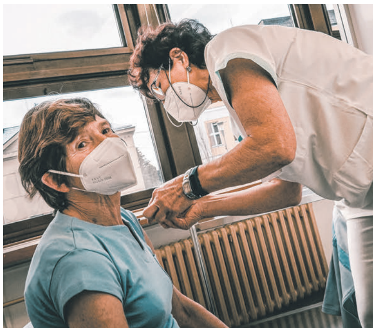
V Rychnově nad Kněžnou zahájilo provoz očkovací centrum.

„Cílem očkování proti covid-19 je chránit obyvatele a omezit další šíření nákazy v populaci, stejně jako snížit počet úmrtí a zabránit přetížení zdravotnických zařízení. Je to cesta, jak ochránit rizikové skupiny obyvatelstva, zdravotnické pracovníky a klíčové složky kritické infrastruktury. Jsem ale přesvědčen, že očkování je také prostředkem, jak pozvolna vrátit náš život k normálu. Tedy pomůže nám nejenom zmírnit obavy z onemocnění a jeho průběhu, pokud už se nakazíme, ale pomůže nám vrátit zážitky, práci a mnohá